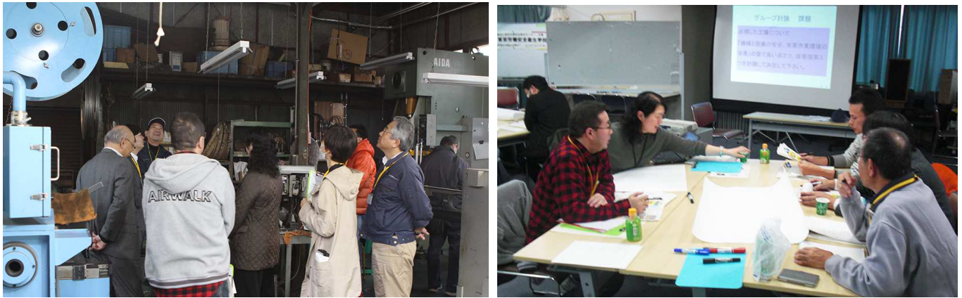
【昨年2017年東京安全学校の工場見学(左)とグループワーク(右)風景から】